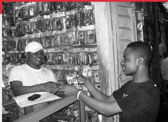
Herr A. (links im Bild) in seinem Geschäft für Mobiltelefon- und Computerzubehör in Nigeria